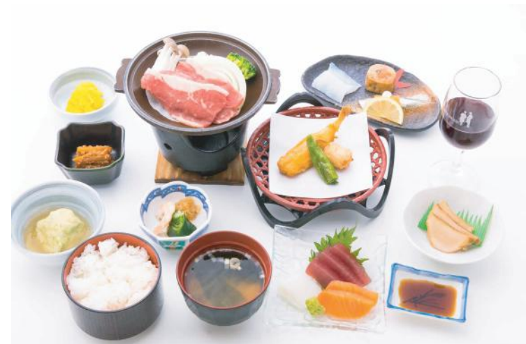
⑧ ミニ会席 . . . . . 2,000 円 (税別)

海鮮の陶板焼 季節の揚物・季節の二点盛・小付三点 季節の煮物・ご飯・おざら・香の物