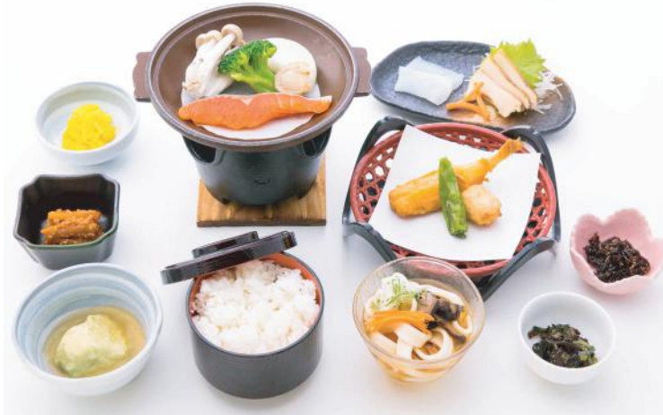
⑤ 甲斐サーモン御膳 . . . 1,500 円 (税別)

甲斐サーモンのワイン蒸し焼 季節の揚物・季節の二点盛・小付三点 季節の煮物・ご飯・おざら・香の物