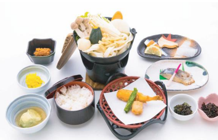
③ほうとう御膳 . . . . . 1,500 円 (税別)

ほうとう鍋 (※ざるそばに変更出来ます) 季節の揚物・季節の三点盛・小付三点・焼物 季節の煮物・ご飯・香の物