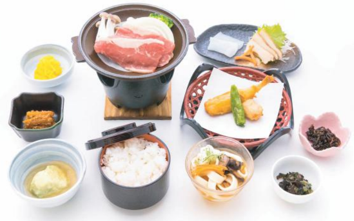
⑥ 特選牛御膳 . . . 1,500 円 (税別)

甲斐サーモンのワイン蒸し焼 季節の揚物・季節の二点盛・小付三点 季節の煮物・ご飯・おざら・香の物