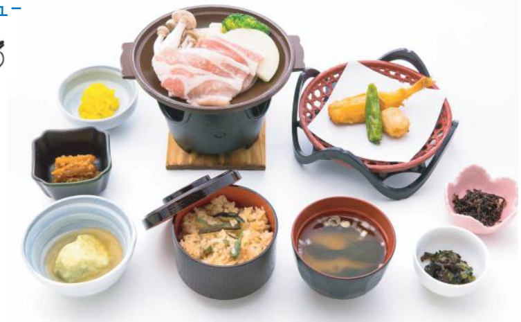
②旬彩膳 . . . . . 1,000 円 (税別)

牛の陶板焼 (ワイン付) 季節の揚物・季節の三点盛・小付三点 季節の煮物・季節の炊込ご飯・味噌汁・香の物