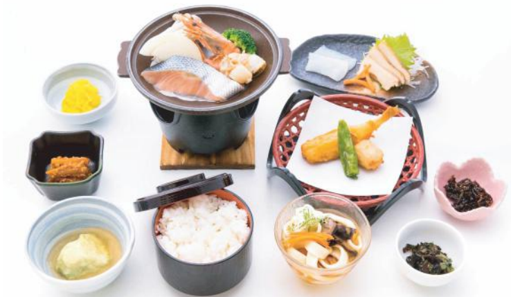
⑦ 海鮮御膳 . . . . . 1,500 円 (税別)

牛の陶板焼 季節の揚物・季節の二点盛・小付三点 季節の煮物・ご飯・おざら・香の物