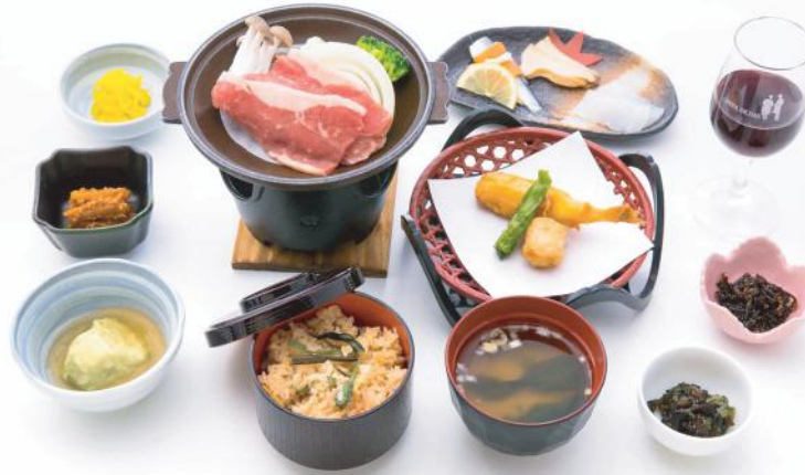
①旬彩膳 . . . . . 1,500 円 (税別)

牛の陶板焼 (ワイン付) 季節の揚物・季節の三点盛・小付三点 季節の煮物・季節の炊込ご飯・味噌汁・香の物