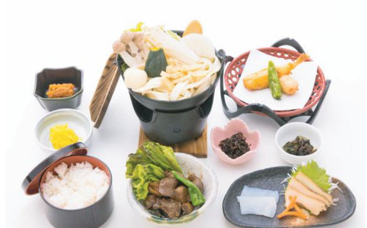
④甲州御膳 . . . . . 1,500 円 (税別)

ほうとう鍋 (※ざるそばに変更出来ます) 季節の揚物・季節の三点盛・小付三点・焼物 季節の煮物・ご飯・香の物